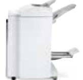
Módulo de acabado para grandes volúmenes con generador de folletos