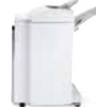
Módulo de acabado de gran volumen